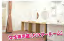
女性専用室(パウダールーム)