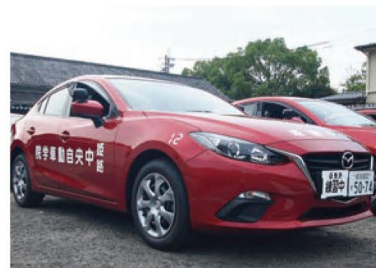
▲教習車両(AT車) マツダ アクセラ