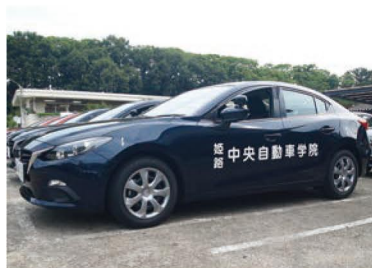
▲教習車両(MT車) マツダ アクセラ